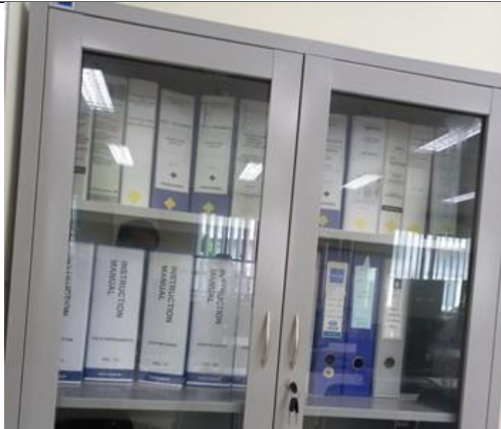
Tủ hồ sơ