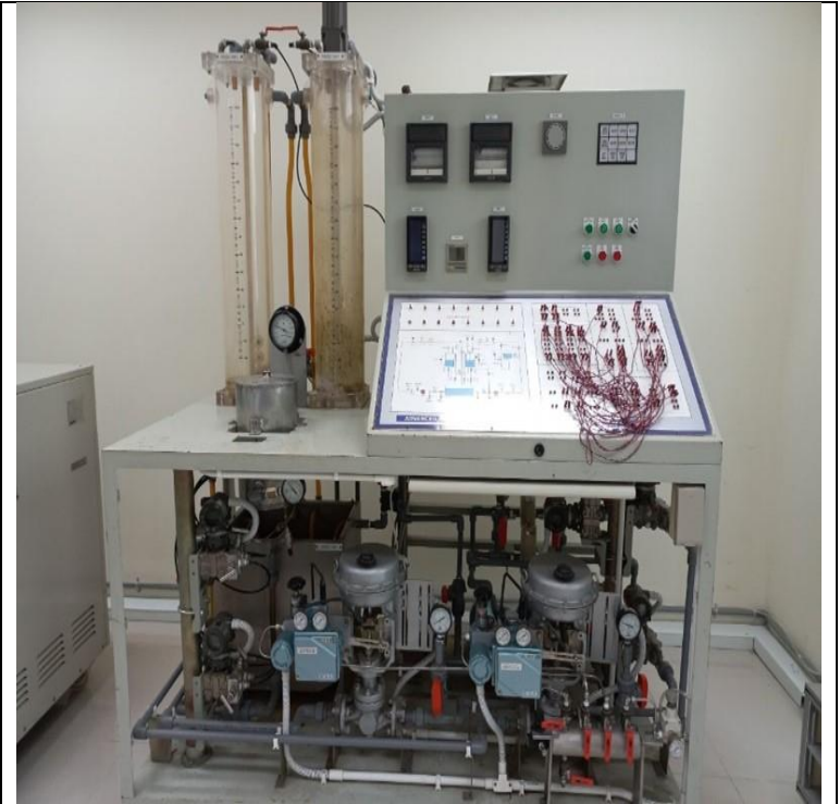
Mô hình plant 1 (Skid_1)