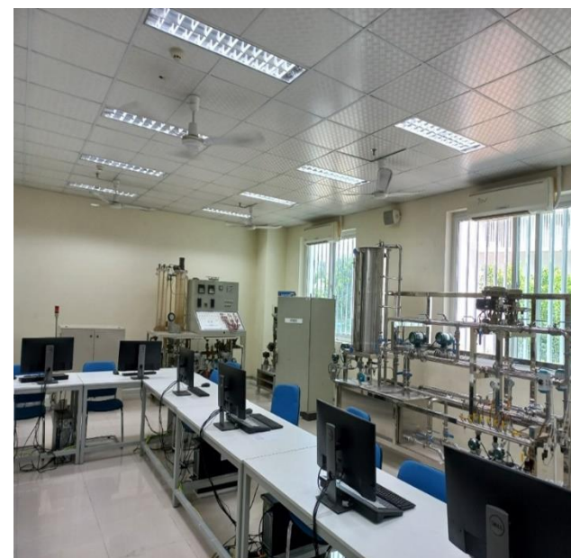
Bên trong phòng Lab