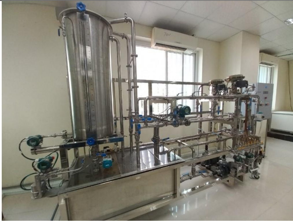
Mô hình plant 2 (Skid_2)