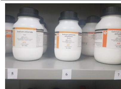
Tủ dụng hóa chất