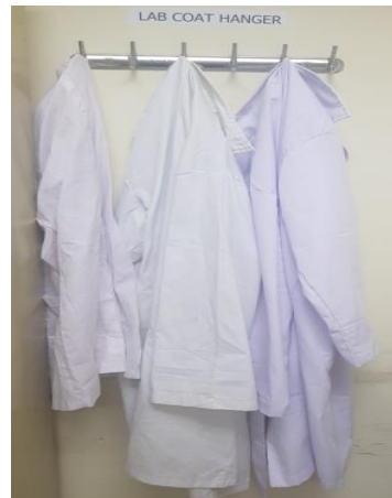
Áo bảo hộ