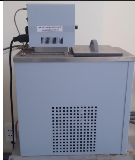
Bể điều nhiệt tuần hoàn

Sấy khô dụng cụ thí nghiệm và làm khô mẫu, hoá chất khi cân hay xử lý mẫu theo quy trình nghiên cứu.