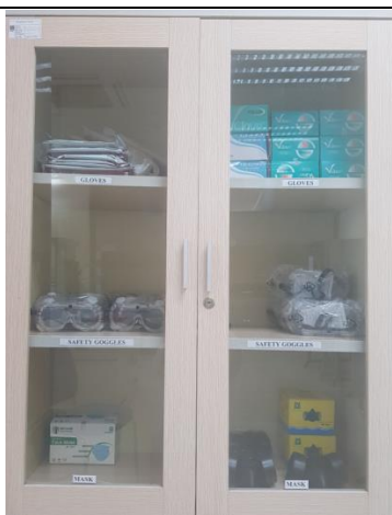
Tủ đựng gang tay, kính và mặt nạ