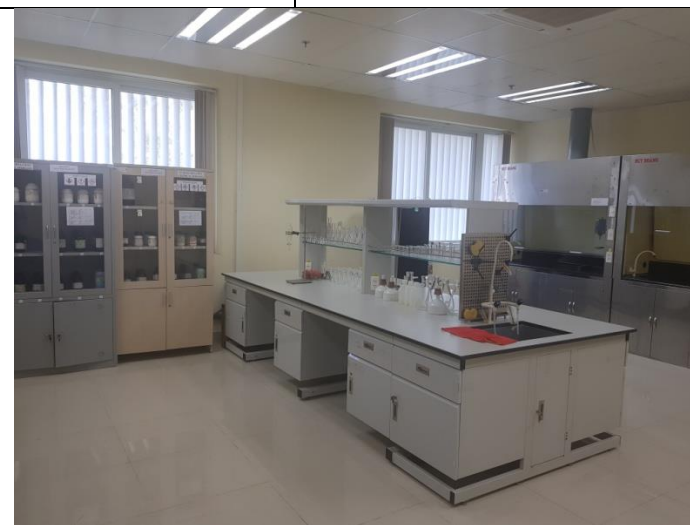
PTN Hóa hữu cơ