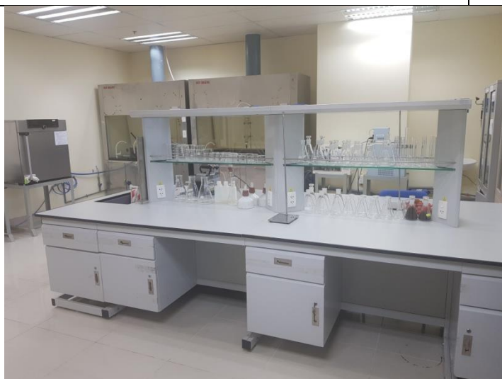
PTN Hóa hữu cơ